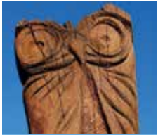
Holz- und Lehm- skulpturen im Park