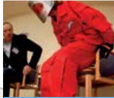
Age Explorer®: Alters- simulationsanzug